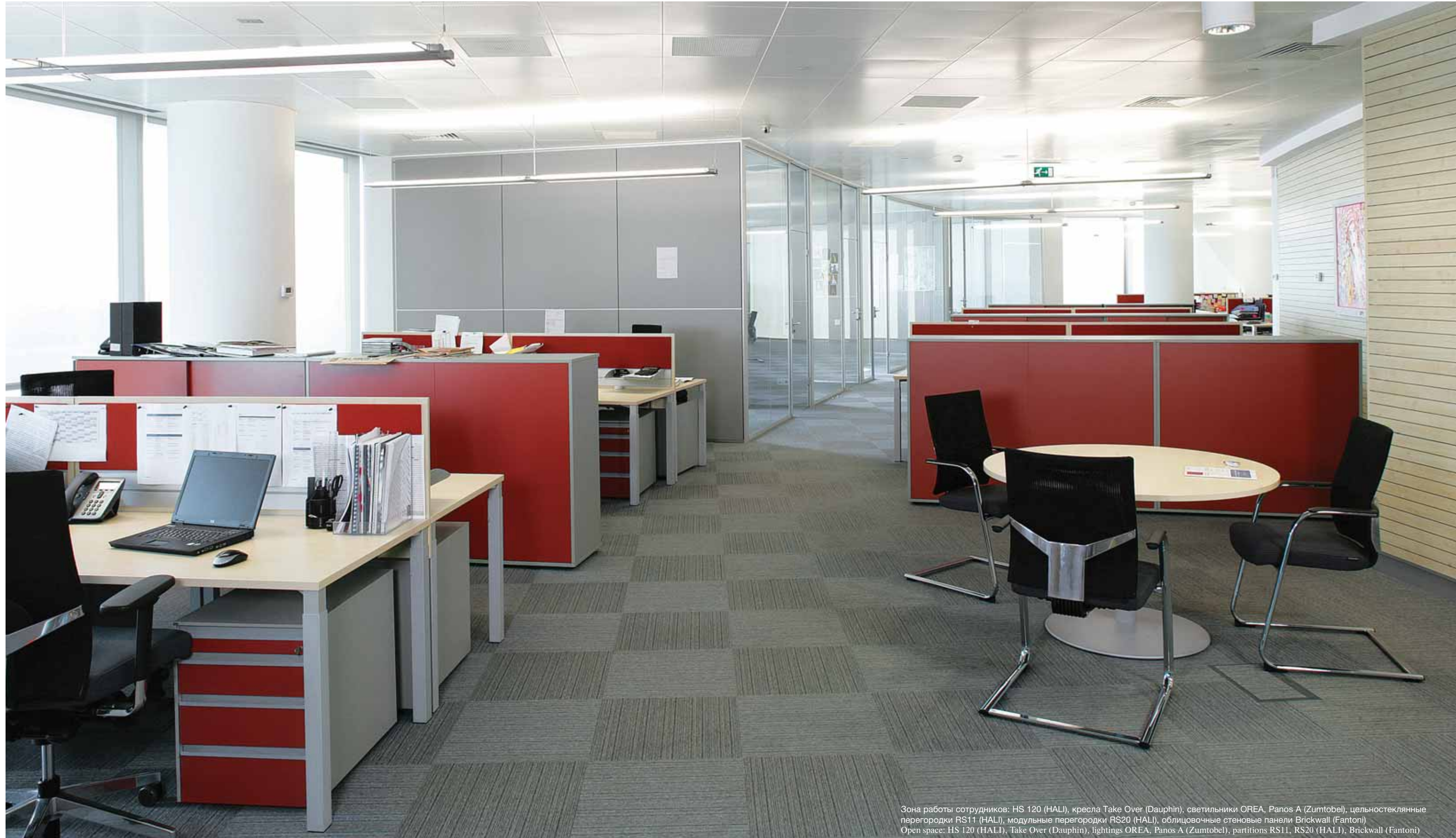
Зона работы сотрудников: HS 120 (HALI), кресла Take Over (Dauphin), светильники OREA, Panos A (Zumtobel), цельностеклянные перегородки RS11 (HALI), модульные перегородки RS20 (HALI), облицовочные стеновые панели Brickwall (Fantoni) Open space: HS 120 (HALI), Take Over (Dauphin), lightings OREA, Panos A (Zumtobel), partitions RS11, RS20 (HALI), Brickwall (Fantoni)