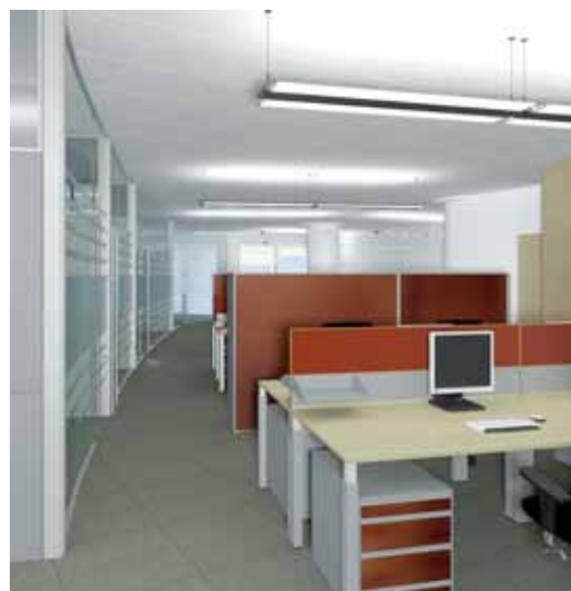
3D-визуализация. Зона работы сотрудников 3D. Open space