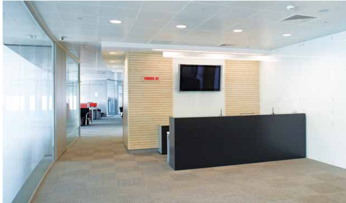
Приемная зона: HALI, светильники Panos H, Slotlight (Zumtobel) | Reception: HALI, lightings Panos H, Slotlight (Zumtobel)