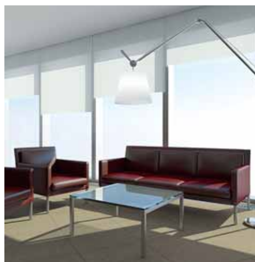
3D-визуализация. Зона ожидания | 3D. Waiting area