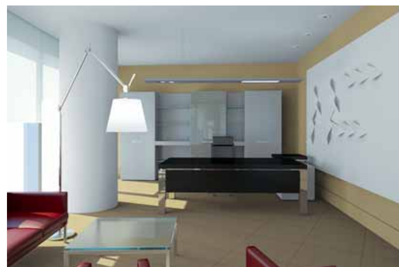
3D-визуализация. Зона работы менеджмента | 3D. Manager's working area

Мебель: HS 120 от HALI, HeadOffice Mono (дизайн Wolfgang C. R. Mezger.) от Walter Knoll Кресла: Take Over (дизайн Klaus Haar, Manfred Elzenbeck) от Dauphin, Tiger (дизайн Ray Carter) от Sato Office, Jason от Walter Knoll Мягкая мебель: Cube от Luxy Офисный свет: Slotlight, Light Fields, Orea, Aero от Zumtobel, NoBody300 от Deltalight Офисные перегородки: цельностеклянные перегородки RS11, модульные перегородки RS20 от HALI, облицовочные стеновые панели Brickwall от Fantoni, трансформируемая звукоизолирующая перегородка Moveo от Dorma