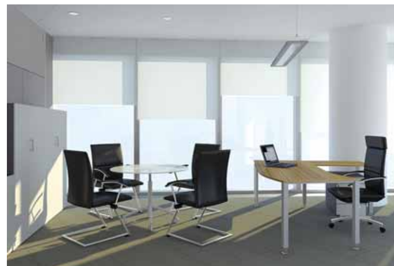
3D-визуализация. Зона работы менеджмента | 3D. Manager's working area