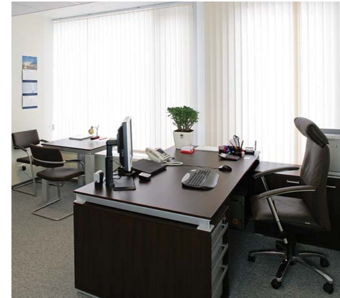
Зона работы менеджмента: HaN (Martex), кресло Tiger (SATO Office) Manager's working area: HaN (Martex), Tiger (SATO Office)